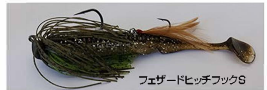
フェザードヒッチフックS