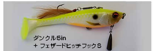
ダンクル5in + フェザードヒッチフックS