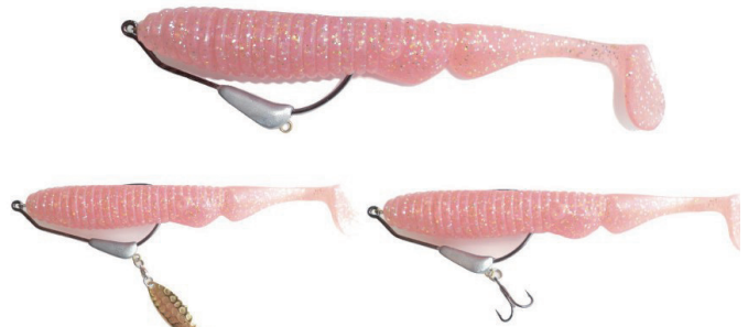
後付けブレードチューン例